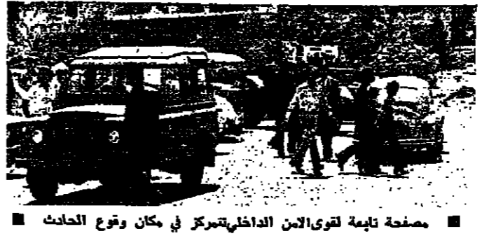
مصلحة تابعة لقوى الامن الداخلي تتحرك في مكان وقوع الحادث